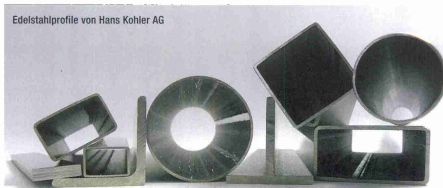
Edelstahlprofile von Hans Kohler AG