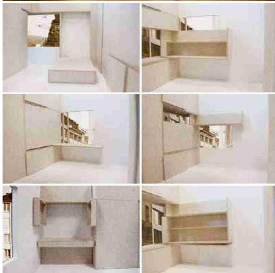
«Bus Stop» heisst das Projekt, welches ein Chalet auf dem Zentralplatz vorsieht. Dadurch, dass sich die Möbel in der Wand verstecken lassen, wird der Platz optimal genutzt.