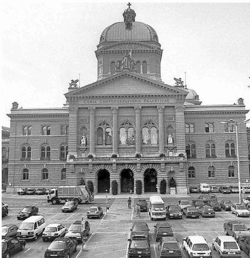
So sah es vor dem Bundeshaus bis 2002 aus.

Themen-Nr.: 375.19 Abo-Nr.: 1074128 Seite: 37 Fläche: 133'080 mm 2