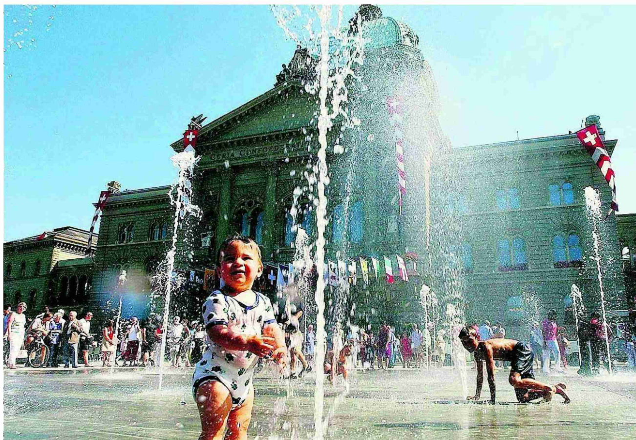
Die Umsetzung des Bundesplatz-Siegerprojekts begeistert Jung und Alt seit der Eröffnung 2004.