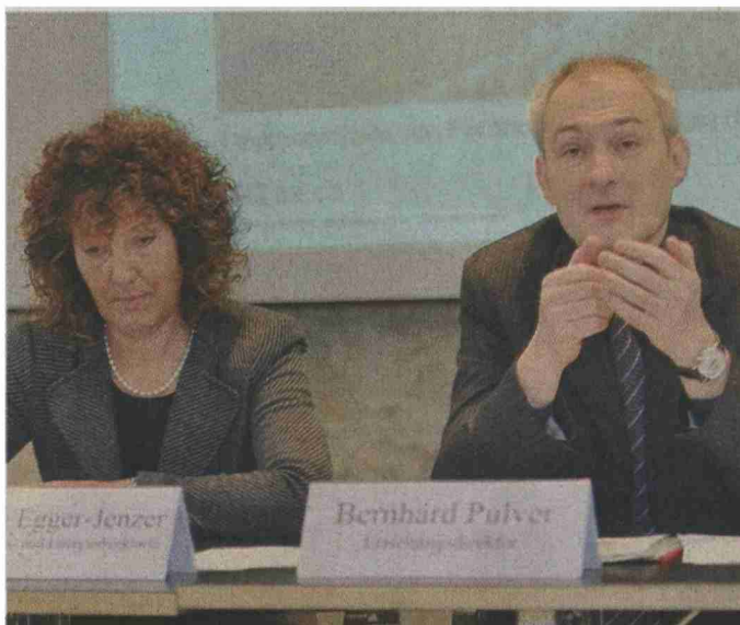
Im Februar 2011 verkündet die Regierung ihren Entscheid für eine Teilkonzentration in Bern und Biel.