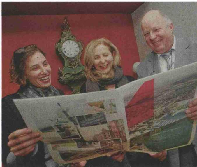
Im Dezember 2010 tritt das neue «Komitee Campus Biel/Bienne» an die Öffentlichkeit und wirbt für Biel.

Themen-Nr.: 375.19 Abo-Nr.: 1074128 Seite: 10 Fläche: 108'202 mm 2